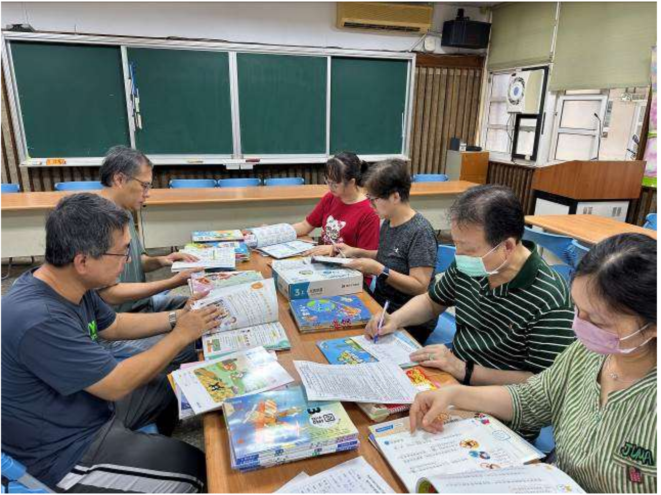
教科書遴選活動照片