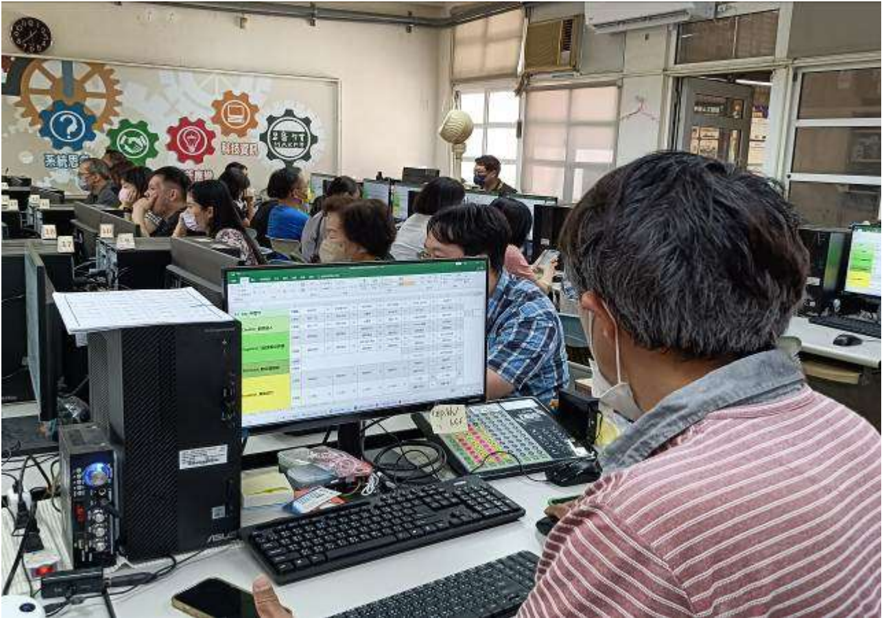
第三次課發會及初審活動照片