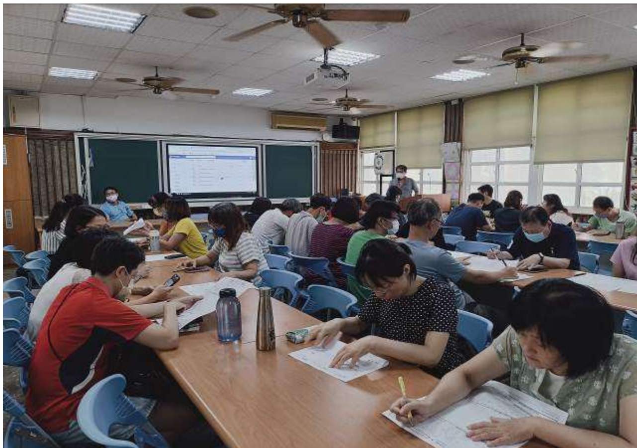
第四次課發會及複審活動照片